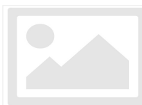
PORTFEUILLE DE CLIE...